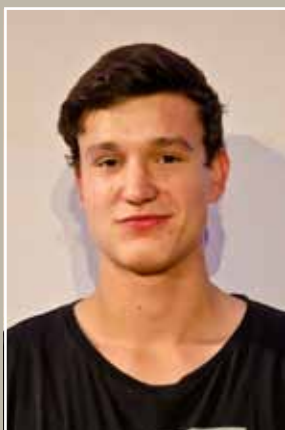
Jannis Velm Sulz am Neckar